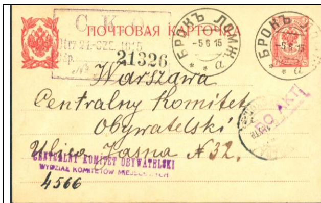
Służbowa karta pocztowa, służąca do przesyłania oficjalnych informacji służbowych. Na karcie widoczny stempel poczty w Broku z datownikiem z czerwca 1915 roku 25 .

Ponadto poczta w Broku figuruje w oficjalnym wykazie poczt i urzędów pocztowo-telegraficznych, ewakuowanych do Rosji w 1915 roku z Guberni Łomżyńskiej 26 . Losy tej poczty i jej personelu zostały ujęte poniżej przy omawianiu przymusowej ewakuacji tych urzędów w lipcu 1915 roku i ich pobytu w głębi Rosji. Tak więc stan organizacyjny poczt w powiecie ostrowskim przed ich likwidacją i wywózką na skutek działań wojennych w lipcu 1915 roku przedstawiał się następująco: