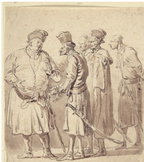
Ilustracja 2. Jan Piotr Norblin, Typy szlachty polskiej , rysunek.