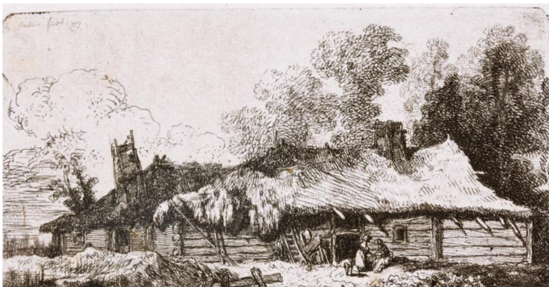
Ilustracja 3. Jan Piotr Norblin, Chłopska zagroda , akwaforta 1777.

Podatki pogłównego z lat 1673 i 1674 zostały uchwalone po latach prawie nieprzerwanego pasma wojen, głodu, epidemii i wszelkich innych katastrof. W przypadku prawobrzeżnej części parafii brokowskiej dysponowałem danymi o liczbie ludności i budynków z okresu sprzed potopu szwedzkiego, pochodzącymi z akt lustracyjnych dóbr biskupów płockich. Chodzi przede wszystkim o dane z rejestrów podatku podymnego płaconego w roku 1638 „od każdego komina nad dach wyprowadzonego, a gdzie nie masz komina, od każdej chałupy zamieszkałej” 21 oraz spisy poddanych i ich powinności sporządzone w roku 1650. Umożliwia to dokonanie porównania z danymi z lat 1673 i 1674, celem ukazania skali wojennych spustoszeń.