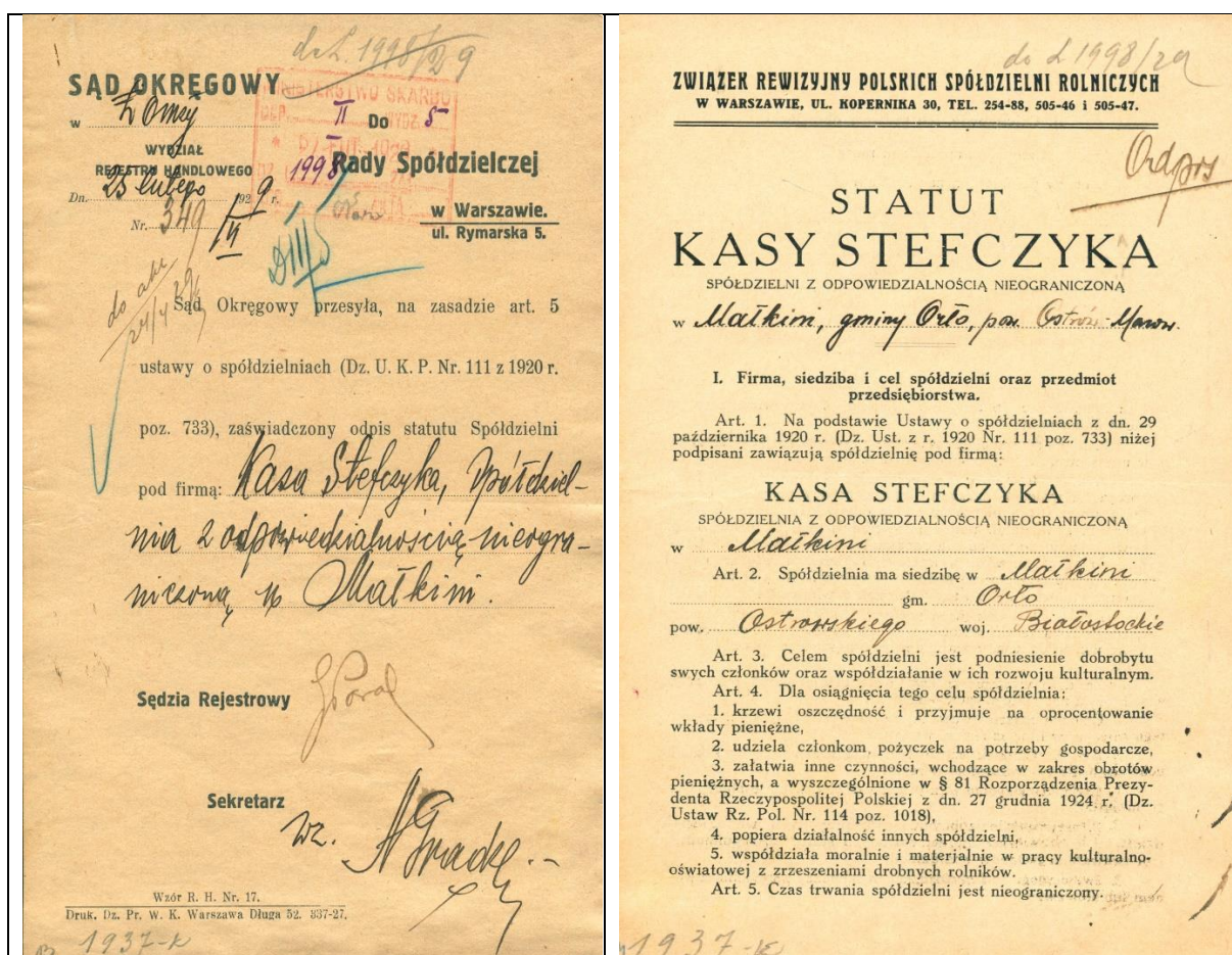
Wyciąg z Rejestru Handlowego Sądu Okręgowego w Łomży oraz pierwsza strona statutu Kasy Stefczyka w Małkini.