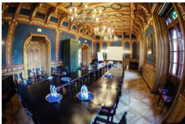
Ilustracje 3, 4, 5. Fronton oraz wnętrza pałacu w Starejwsi w pow. węgrowskim. Obecnie pałac pełni funkcję ośrodka szkoleniowego Narodowego Banku Polskiego.