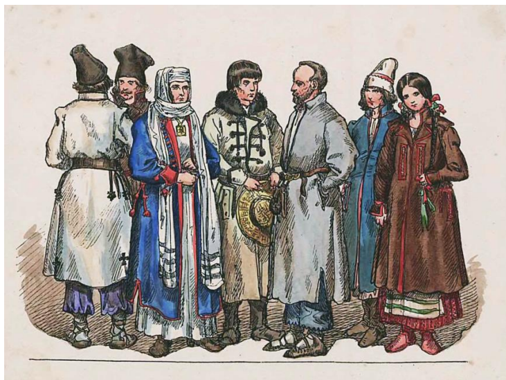
Ilustracja 2. Włościanie w latach 1674-1696. Litografia Jana Matejki z serii Ubiory w Polsce 1200-1795 , nr 79.

sprawami gospodarczymi, podczas gdy urzędnicy byli także reprezentantami prawnymi właściciela majątku i występowali np. w roli pana feudalnego w sądach wiejskich.