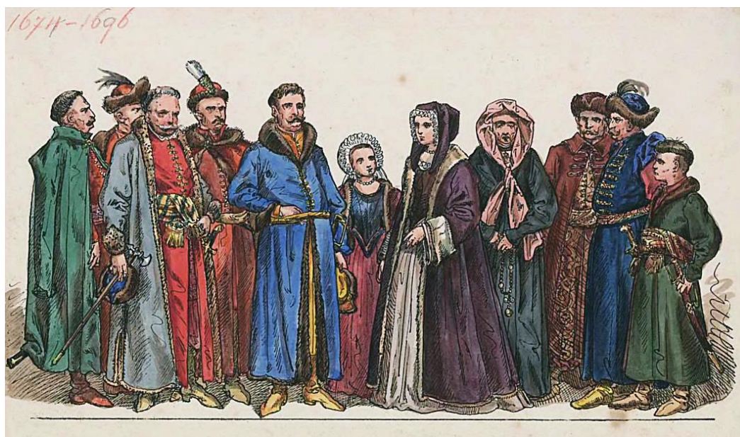
Ilustracja 1. Szlachta w latach 1674-1696. Litografia Jana Matejki z serii Ubiory w Polsce 1200-1795 , nr 74.

Podobnie jak w przypadkach omawianych w poprzednich częściach, zastanawia ogólny spadek liczby podatników w roku 1674 w porównaniu z rokiem poprzednim. Czasami przybiera rozmiary tak katastrofalne, iż nie można wykluczyć jakiegoś kataklizmu, ale chodzi raczej o optymalizację podatkową. Np. w Uścianku mieszkało w roku 1673 – nie licząc mieszkańców dworu i folwarku – 40 zdatnych do opodatkowania osób i miały zapłacić razem 33 zł. Rok później podatników było już tylko 23, danina zaś wyniosła 16 zł, a przecież nie pozostały przekazy o szalejącej w tym czasie, dziesiątkującej ludność zarazie.