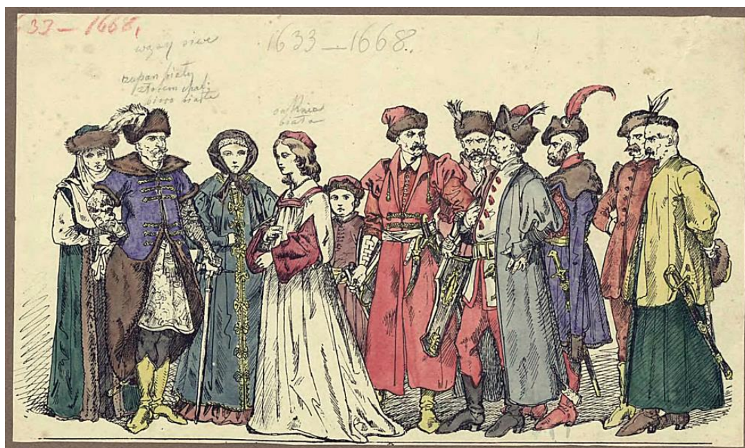
Ilustracja 2. Szlachta w latach 1633-1668.

Źródło: Biblioteka Cyfrowa Uniwersytetu Wrocławskiego bibliotekacyfrowa.pl.