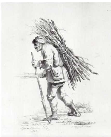
Ilustracja 3. Aleksander Orłowski, Chłop niosący chrust na plecach, Muzeum Narodowe w Warszawie.

Suma pogłównego z miasta Andrzejewa 200 zł i tyle wpłynęło, co poborca powiatu nurskiego Tomasz Gołębiowski potwierdził dnia 6 lipca 1764 r. 28