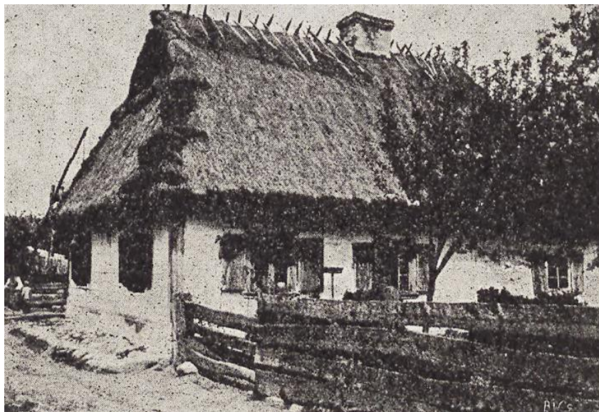
Ilustracja 3. Przełom XIX i XX w. Dom zagrodowego szlachcica we wsi Radule n. Narwią. 21 .

bywało w niejednej dużej wiosce jak choćby w Ruskołęce. W latach 1638 i 1650 stały w tejże Ruskołęce 62 domy i tyleż było głów rodzin. W roku 1673 głów rodzin było w tej wsi 36. W Łętownicy stały w 1638 r. 23 domy, a 22 lata później było domów 26 i tyleż głów rodzin. W roku 1673 głów rodzin było w tej wiosce 19, przy czym nie wszyscy zamieszkiwali w osobnych domach. Zniszczenia na wsi były podobnie, jak w innych biskupich wioskach nieporównywalnie mniejsze niż w miastach, a przynajmniej życie powracało na wieś znacznie szybciej niż do miast.