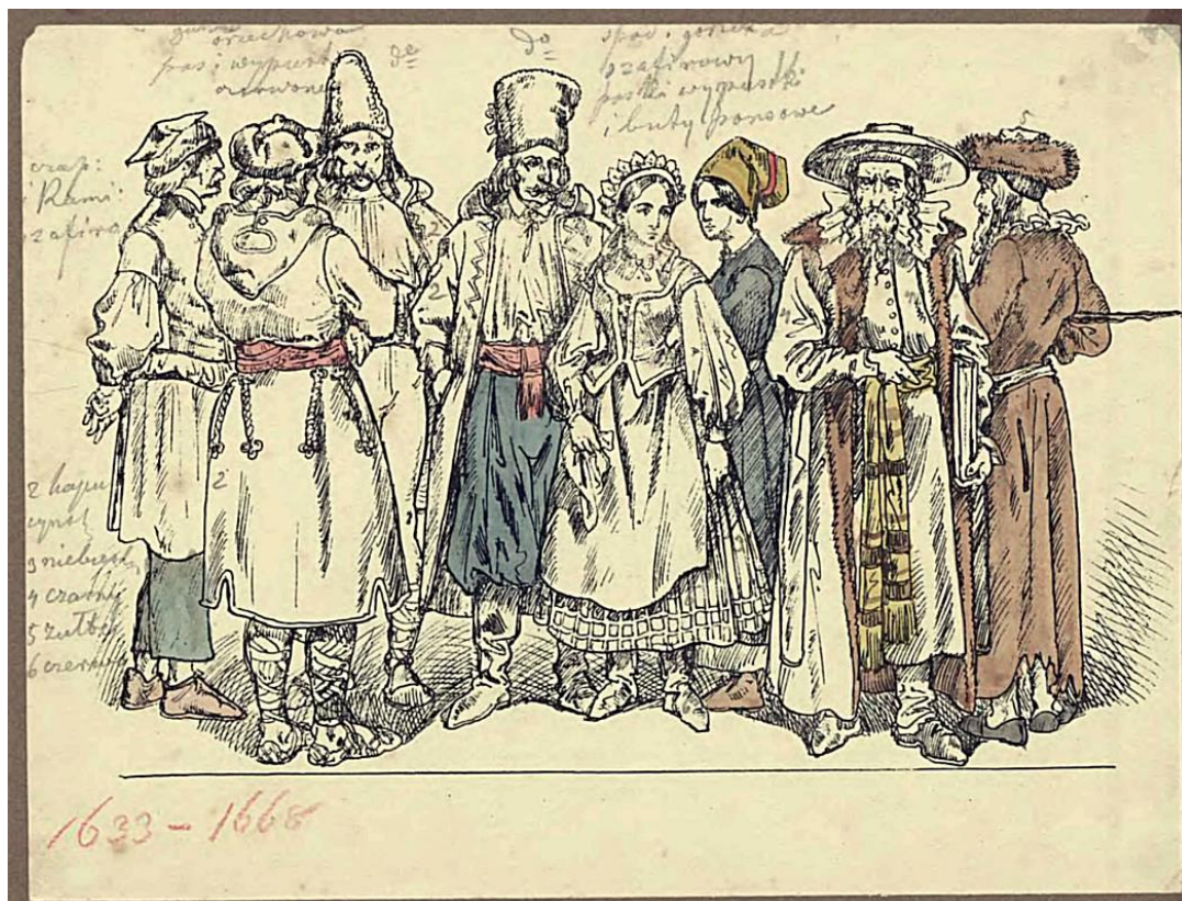
Ilustracja 1. Żydzi i włościanie w latach 1633-1668. Od lewej czterech włościan, dwie włościanki i dwóch Żydów. Niedokończone kolorowanie ryciny.

Litografia Jana Matejki z serii Ubiory w Polsce 1200-1795 , nr 70.