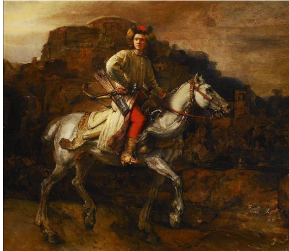
Ilustracja 3. Rembrandt Harmenszoon van Rijn, Jeździec polski (obraz znany także pod nazwą Lisowczyk ), olej na płótnie ok. 1655r., w zbiorach Kolekcji Flicka w Nowym Jorku.