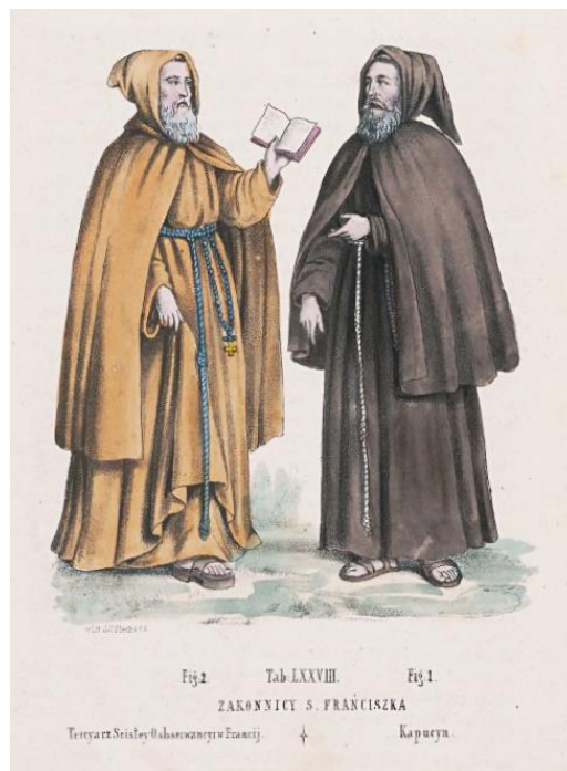
Ilustracja 5. Zakonnicy św. Franciszka 19 .