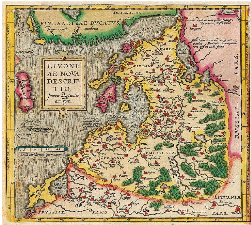
Ilustracja 5. Mapa Inflant z atlasu Theatrum Orbis Terrarum Abrahama Orteliusa, 1592 r.