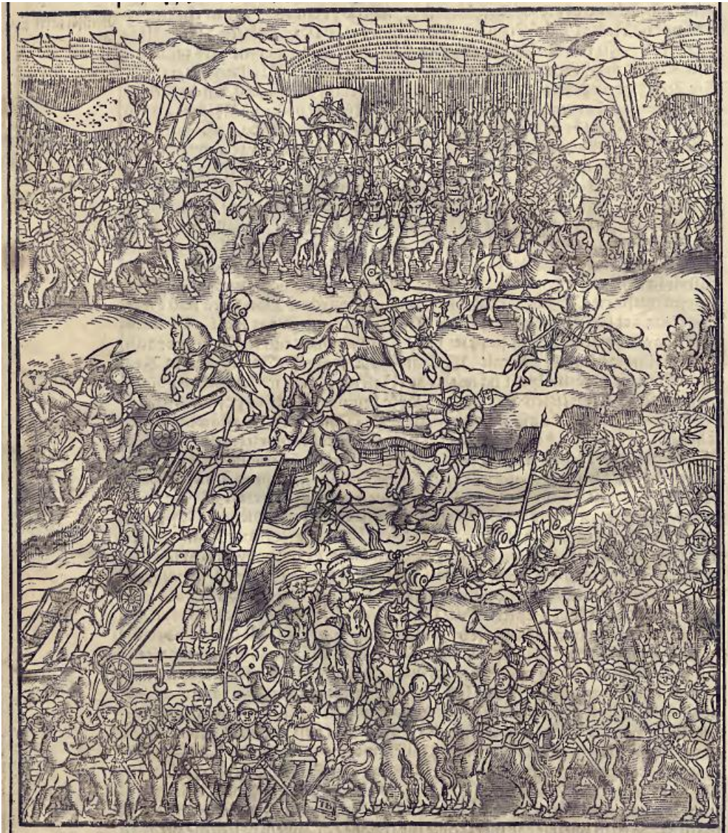
Ilustracja 2. Pojedyunki zagończyków przed bitwą z Moskalami w roku 1514 3 .

Kiedy zaś Moskale posiadli Smoleńsk, byt i całość Litwy, a nawet i całej Polski, chwiać się zaczęły” 2 .