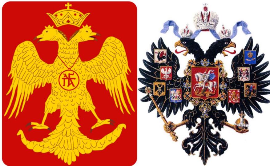
Ilustracja 1. Po lewej stronie dwugłowy orzeł Bizancjum z monogramem dynastii Paleologów (gr. Παλαιολόγος ) na piersi. Po stronie prawej mały państwowy herb Rosji pod rządami Aleksandra III (cesarz Rosji i m.in. król polski w latach 1881-1894), na lewym skrzydle widoczny orzeł Królestwa Polskiego.