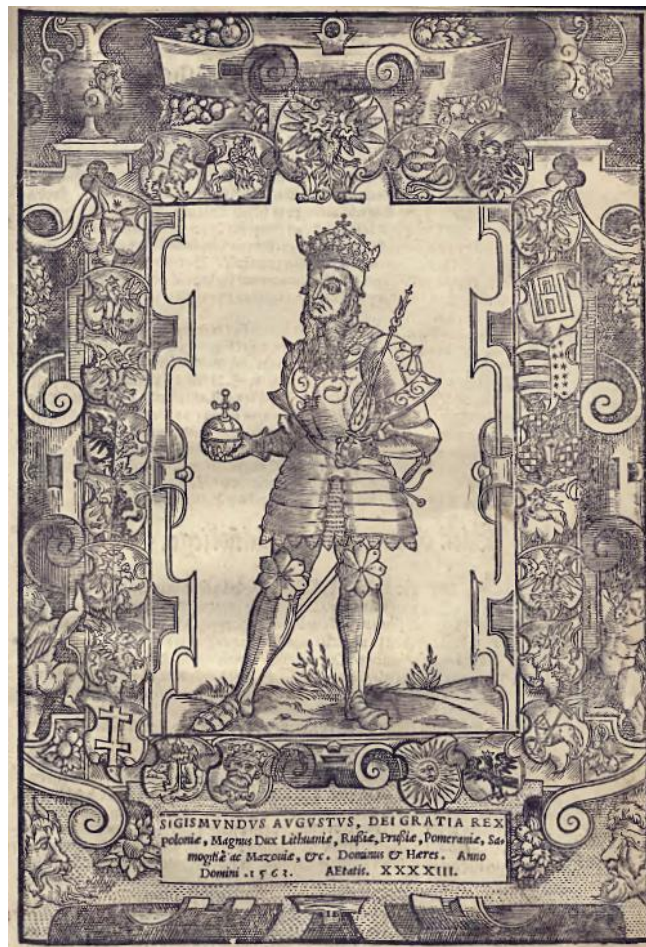
Ilustracja 4. Zygmunt August, na rycinie z książki wydrukowanej w 1564 r. 4

W listopadzie 1561 roku zawarto w Wilnie kolejny układ, na mocy którego Kettler otrzymał w lenno Kurlandię i Semigalię. Pozostałe tereny Inflant stały się wspólną domeną Polski i Litwy, a ich mieszkańcom zagwarantowano wolność wyznania i dotychczasowe prawa. Ryga miała uzyskać status podobny do Gdańska i właśnie w Rydze Kettler złożył hołd lenny. Król Zygmunt August był nieobecny, a hołd przyjął Mikołaj Radziwiłł zwany Czarnym.