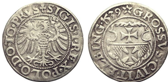
Ilustracja 9. Grosz Zygmunta Starego 1539 r., mennica w Elblągu, fot. Gabinet Numizmatyczny D. Marciniak.

Razem do wybrania ze wszystkich miast, wiosek, dóbr powiatu nurskiego 1877 zł 29 gr.