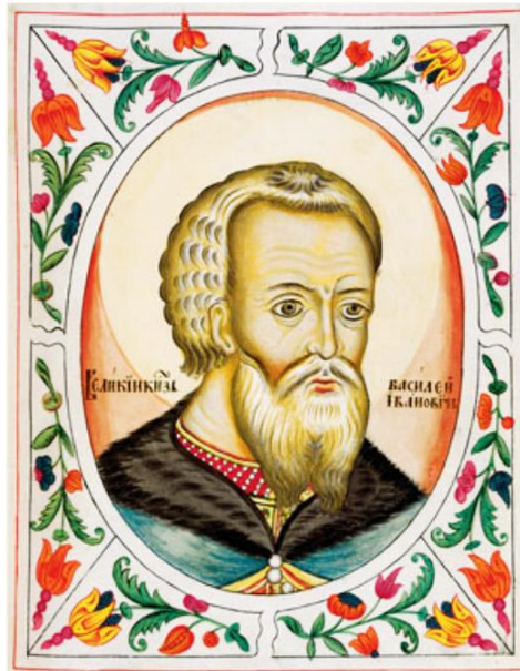
Ilustracja 3. Wasyl III Srogi, miniatura z Carского tytułarnika .

Wyczerpanym stronom nie pozostało nic innego, jak szukać porozumienia. Tym razem nie silono się nawet na wzniosłe słowa o pokoju wiecznym. Zawarto rozejm, na zasadzie usankcjonowania wszystkich dotychczasowych zdobyczy i strat wojennych, co dla Litwy oznaczało pogodzenie się ze stratą Smoleńska i ziemi smoleńskiej. Akurat w tym wypadku pojęcie „wieczny” miałyby swoje uzasadnienie, gdyż Smoleńsk zostanie odbity przez Rzeczpospolitą w roku 1611, czyli po 97 latach pozostawania w rękach moskiewskich.