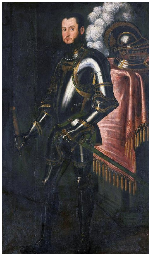
Ilustracja 7. Zygmunt August w zbroi, portret autorstwa nieznanego artysty, Bayerische Staatsgemäldesammlungen.

Pod pretekstem panującej w Krakowie zarazy, ledwie po trzech miesiącach od wesela Zygmunt August udał się do Wilna, pozostawiając małżonkę na pastwę pandemii. Bona wyposażyła syna w kieszonkowe w postaci 15 tys. dukatów, 40 srebrnych pucharów i wielu złotych łańcuchów 19 . Nie narzekał na brak towarzystwa, bo wraz z nim wyruszyła na północ „złota młodzież” magnacka, a ich śladem postępowały nałożnice. Wybuchł skandal grożący nawet konfliktem zbrojnym. Wszyscy zabiegali o rozniecenie w młodym królu małżeńskich uczuć, co ten postanowił wykorzystać jako pretekst do objęcia samodzielnych rządów na Litwie. Nieszczęśliwy, samotny małżonek uważał się bowiem, że „nie mam nawet miejsca, gdzie bym mógł zamieszkać z królową żoną” 20 .