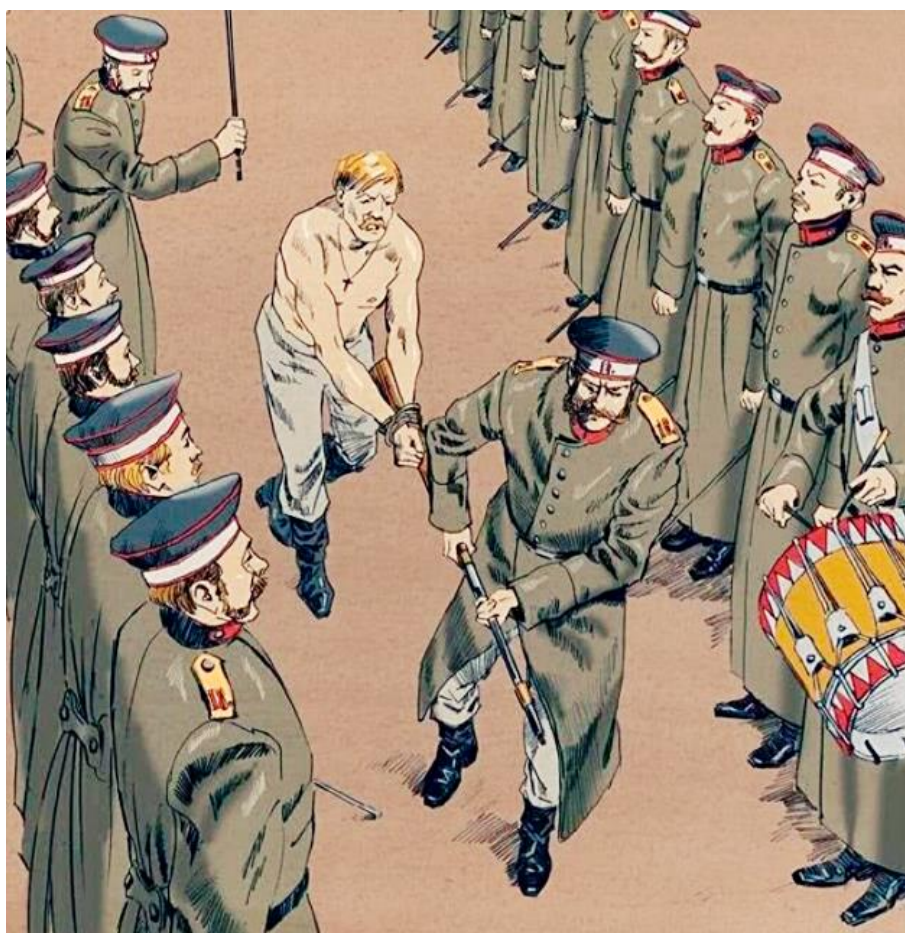
Ilustracja 3. Rosja XIX w. Karanie żołnierza, poprzez poprowadzenie między dwoma szeregami zbrojnych w kije, różgi lub szpicruty żołnierzy. Każdy musiał uderzyć i to czasami wielokrotnie.

Większość żołnierzy nie kwaterowała jednak w omawianym czasie w koszarach czy chłopskich chałupach, ale w ziemiankach, czyli w wykopanych, w ziemi jamach, wyłożonych deskami, albo okrągłakami. W wersji luksusowej ziemianka była wyposażona w piec i prycze, ale żołnierze spali zwykle na przykrytej korą i słomą gołej ziemi.