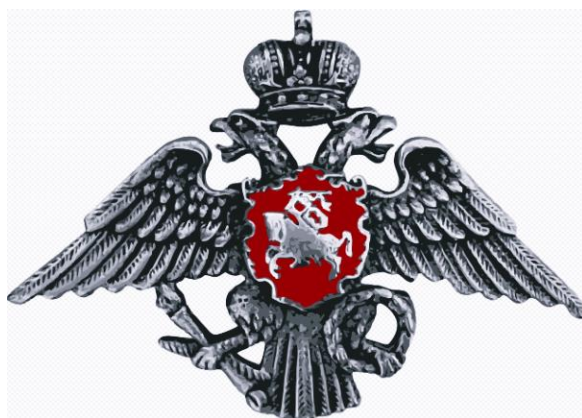
Ilustracja 5. Rosja XIX w. Znak na czapce gwardzisty z Litewskiego Pułku Gwardii Cesarskiej.

Według wielokrotnie tu cytowanego Wiesława Cabana do kraju powracało mniej niż 10%, żołnierzy. Zapewne podobny ich procent pozostawał z różnych powodów w Rosji, a karnie wcieleni do wojska musieli po prostu osiąść na stałe we wskazanym miejscu. Także ci, którzy trafili do oddziałów kozackich, musieli pozostać w Rosji na zawsze.