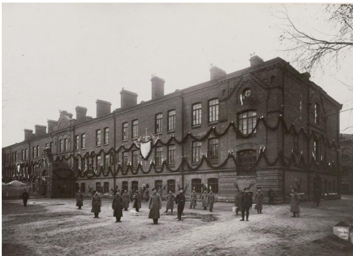
Ilustracja 8. Komerów koło Ostrowi Mazowieckiej 1911 r. Koszary stacjonującego tam 24 Symbirskiego Pułku Piechoty 49 .

By zrzucić szynel, należało dodatkowo wspomóc pułkowych medyków, a i owe 300 rubli przekazać przedsiębiorczemu oficerowi. Dobrze się stało. gdyż ów osławiony Kołomiński Pułk Piechoty został później niemal do nogi wybity w Prusach Wschodnich, a tym samym nasz naród zostałby pozbawiony wielkiego człowieka.