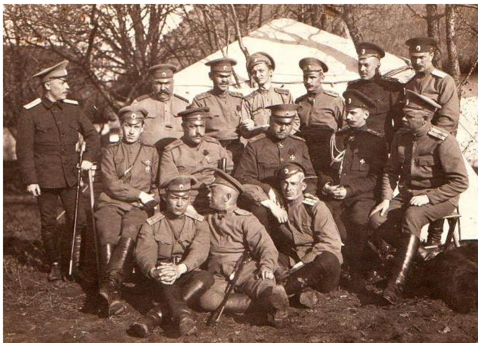
Ilustracja 10. Grupa oficerów 5 Finlandzkiego Pułku Strzelców ok. roku 1914.

Po roku 1901 ograniczono autonomię Finlandii, rozwiązano pułki fińskie, Finów zaś zwolniono z poboru, nakładając na nich w zamian specjalny podatek. Decyzję tę podjęto ponoć z obawy o bezpieczeństwo Sankt Petersburga w razie wybuchu wojny z Niemcami. Nazwa pułki finlandzkie, nie zaś fińskie, jest zatem właściwa, gdyż służyły w nich przeróżne narodowości, w tym wielu Polaków. Najwięcej żołnierzy, których nazwiska znajdują się na węgrowskich listach, służyło w 5 Finlandzkim Pułku Strzelców. Przez większość czasu jednostka stacjonowała w fińskim mieście Mikkeli, przed samym zaś wybuchem wojny w leżącej nad Zatoką Fińską Haminie, a po wybuchu dyslokowano ją w okolice Warszawy.