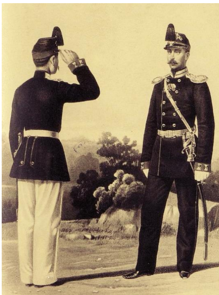
Ilustracja 4. Szeregowy i starszy oficer Pułku Grenadierów Gwardii Cesarskiej w roku 1864 28 .

Okazją do zarobieniu garści kopiejek były roboty publiczne, czyli wynajmowanie żołnierzy np. do robót drogowych lub żniwnych. Żołnierze cieszyli się zwykle na takie ponadplanowe zajęcia, gdyż nikt nie stał nad nimi z kijem, a brzuch można było napełnić lepszym, świeżym jedzeniem. Szołdatów nie wynajmowano do pracy za darmo. Z otrzymanych pieniędzy: 1/3 przeznaczano na potrzeby gospodarcze jednostki, 1/3 dzielono między zatrudnionych żołnierzy, a 1/3 równo pomiędzy zatrudnionych i tych, którzy musieli pozostać w koszarach 27 .