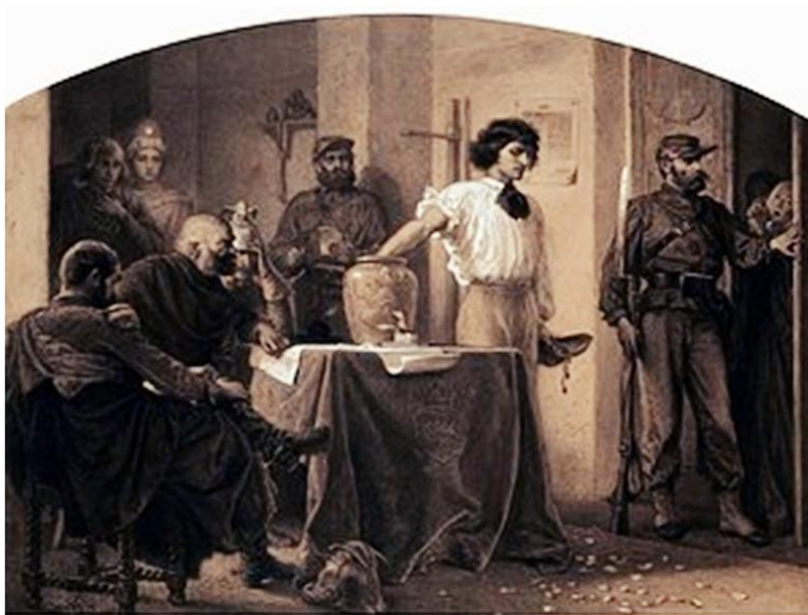
Ilustracja 1. Artur Grottger, Losowanie rekrutów w 1866 r.

To jeszcze nic, co tutaj słyszysz. Ale żebyś to ze mną była, kiedy z chałup ich brałem, to dopiero było... sądny dzień. Jednego tylko Piotra, syna Janowej, udało mi się wziąć bez lamentów i krzyków. Sam mi się jakoś nawinał. Wiesz co, gdyby mi kto powiedział: czy wolisz dostać sto batów kozackich, odlewanych (byle bez świadków i nikt nie wiedział), czy też iść drugi raz po rekrutów, powiedziałbym: dawaj baty 10 .