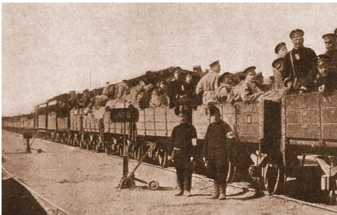
Ilustracja 11. Lata 1914-1915. Transport syberyjskich pułków koleją.

Kilkudziesięciu ze znajdujących się na listach żołnierzy, służyło w syberyjskich pułkach strzelców, a najwięcej w szóstym, stacjonującym w lipcu 1914 r. wyjątkowo daleko od ziem ojczystych, bo w Kraju Nadmorskim ze stolicą we Władywostoku. Także tę jednostkę dyslokowano w październiku 1914 r. w okolice Warszawy. Miejmy nadzieję, że przynajmniej część rekrutów z ziemi węgrowskiej nie miała okazji ujrzeć Oceanu Spokojnego, gdyż została skierowana do tego pułku w ramach uzupełnień. Dziesięciu żołnierzy służyło w 9 Syberyjskim Pułku Grenadierów, stacjonującym w lipcu 1914 w położonym na wschód od Moskwy Włodzimierzu.