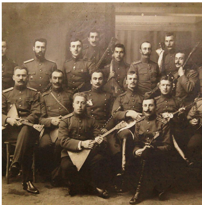
Ilustracja 7. Oficerowie ze stacjonującego w Komorowie koło Ostrowi Mazowieckiej 23 Nizowskiego Pułku Piechoty.

Dobrze zbudowani i jak na ówczesne standardy wysocy, bo liczący ponad 170 cm wzrostu rekruci mogli być prawie pewni, że trafią do Petersburga lub Moskwy, do Korpusu Gwardii i Korpusu Grenadierów. Na nieco „gorszy” sort godziła się kawaleria, dowódcom zaś jednostek saperskich wzrost był obojętny – zależało im natomiast na ludziach krzepkich. Dowódcy innych rodzajów wojsk specjalnych żądań nie mieli i wymagano jedynie, aby do azjatyckiej części Rosji kierować mężczyzn „bezwzględnie zdrowych” 44 .