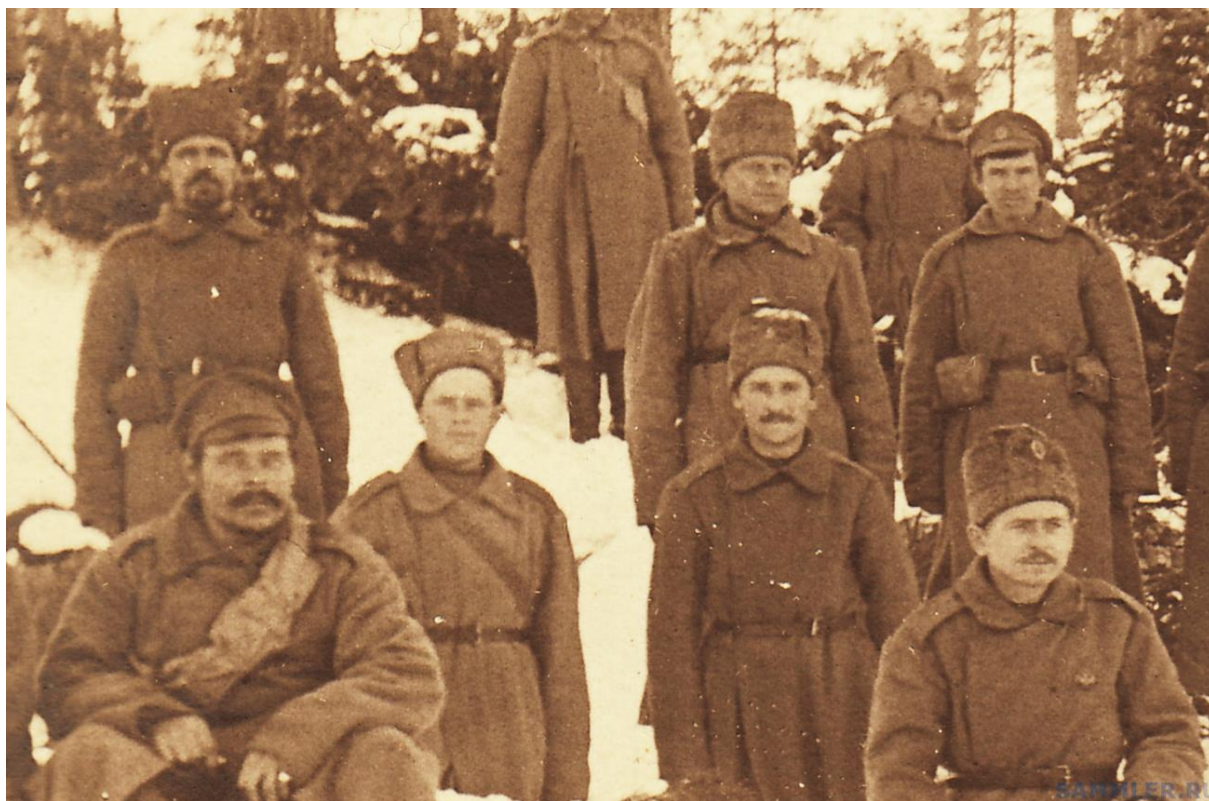
Ilustracja 9. Gdzieś na froncie, zima 1916/1917. Żołnierze stacjonującego przed wojną w Siedlcach 70 Riażskiego Pułk Piechoty.

Z pomocą przyszedł były pracodawca, którego z polskim, zasiadającym w komisji lekarzem łączyła działalność w niepodległościowej organizacji. Do aresztu dostarczono wielką porcję machorki, a przed komisję dowłókł się charczący, kaszlący, zaśliniony, słaniający się na nogach, zielonkawy Zombie. Jednak, gdyby nie stanowcza postawa polskiego lekarza, to nawet taka godna pożałowania kreatura trafiłaby do nowo formowanych batalionów.