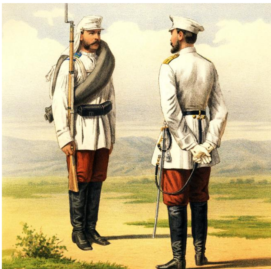
Ilustracja 6. Druga połowa XIX w. Oficer i szeregowy z pułku piechoty stacjonującego w Turkiestanie.

Zwolnienia ze względów rodzinnych przyjęły tak masowy charakter, że pozostał niewielki margines do zwolnień z przyczyn zdrowotnych, a wymogi dotyczące zdrowia poborowych zaliczano do najniższych w Europie. Zaledwie 6% stawających przed komisjami uznawano za niezdatnych do pełnienia służby, a 11% otrzymywało przydział do II kategorii opolczenia , czyli razem 17%. Odsetek odrzuconych ze względów zdrowotnych wynosił w Austro-Węgrzech 57, w Niemczech zaś 37%. Za to w obu tych krajach znacznie mniejszy niż w Rosji odsetek mężczyzn zwalniano z przyczyn rodzinnych 40 .