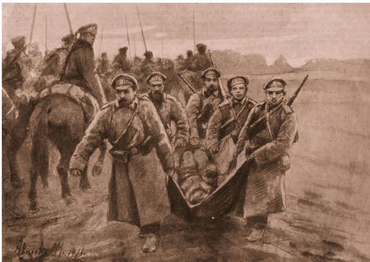
Ilustracja 12. Rok 1816, okolice Łucka. Żołnierze 6 Pułku Strzeleckiego znoszą z pola bitwy rannego kolegę.

Po klęskach armii rosyjskiej podczas wiosny i lata roku 1915, doszło do pewnej stabilizacji na froncie. Z trudem wytrzymujący napór Niemców zachodni alianci nalegali na Rosjan, by rozpoczęli ofensywę. Jej plan opracował generał Aleksiej Brusilow, kilka lat wcześniej pełniący wysokie funkcje dowódcze w Warszawie i Lublinie. Skoncentrował w tajemnicy wielkie siły, w tym artyleryjskie, a mająca przypominać wojnę błyskawiczną operacja została zapoczątkowana w czerwcu 1916 r. na Wołyniu, w rejonie Łucka. W przełamaniu frontu udział wziął stacjonujący przed wojną w Kielcach 6 Pułk Strzelecki. Poniósł wyjątkowo duże straty, a służyło w nim wielu naszych krajan. W czasie trwającej cztery miesiące operacji do niewoli dostały się setki tysięcy żołnierzy austriackich, w tym wielu naszych rodaków. Później ofensywa uległa załamaniu, a straty rosyjskie w zabitych, rannych i wziętych do niewoli liczone na ok. milion żołnierzy.