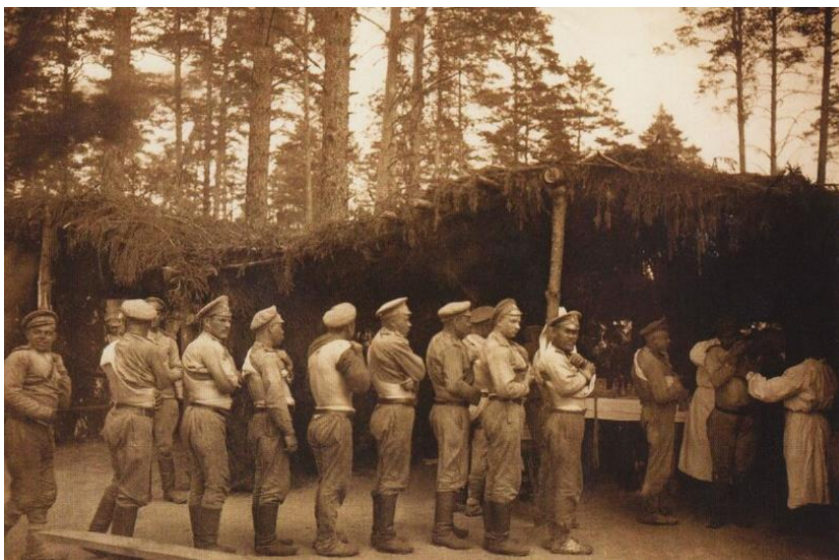
Ilustracja 14. Rok 1916. Polowy punkt opatrunkowy.

Data zdarzenia i rodzaj kartoteki: 01.09.1915 ILS.